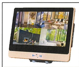
12インチモニター一体型NVR 1台